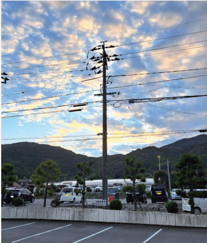
就職、転勤、進学、進級など、4月は何かと変化の多い時期。期待もあれば不安もいっぱい。緊張する場面も多々あります。時には空を見上げ、深呼吸して心を落ち着かせましょう。