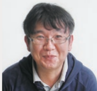
グループホーム和み(介護士)