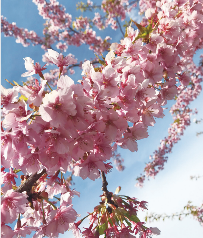
春の訪れとともに咲く桜は、日本の美しさを代表する花です。種類もたくさんあり、咲く時期も色も形もそれぞれ異なります。今年は何種類の桜に出会えるのか今から楽しみです。