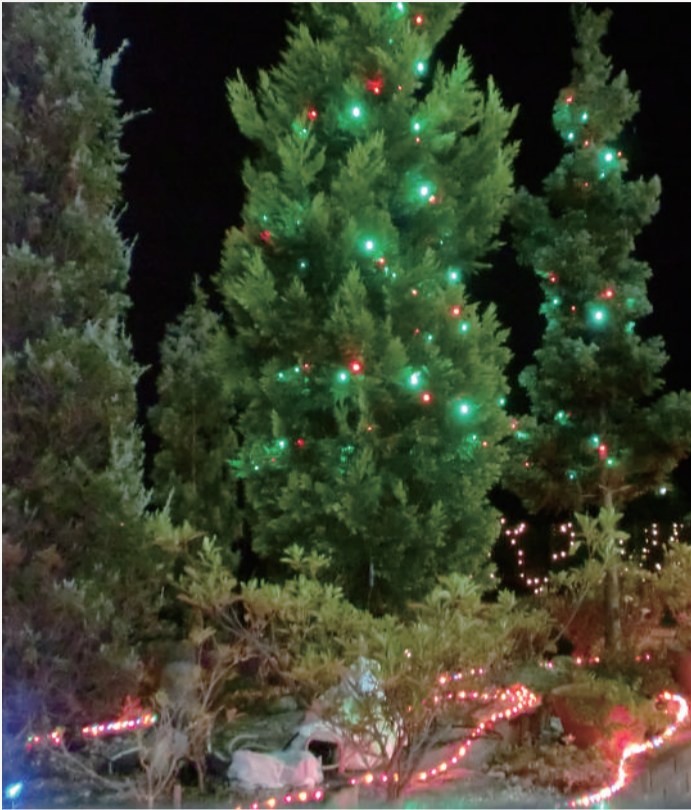
令和最初の年の最後の月になりました。 今年もいろいろなことがありましたが、 クリスマス、お正月と楽しい時間を過ごしたいですね。