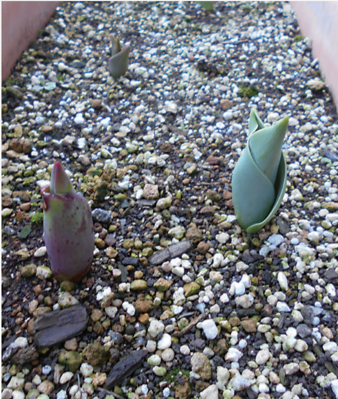
厳しい寒さが少しずつ和らぎ、ぽかぽか陽気の日も増えてきました。展望庭園ではチューリップの芽がぐんぐん育っています。もうすぐ訪れる春に備え、植物は花開く準備を始めているようです。