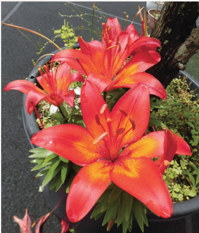
雨上がりの展望庭園を散歩しました。 花びらに残った雨の雫が太陽の光を受けてキラリ。 夏の到来を予感させる美しい輝きでした。