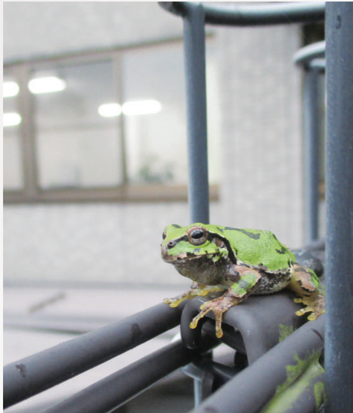
雨上がりにひと休み中のカエルを発見。 ウトウトと眠そうな姿に癒されました。 季節はすっかり梅雨になりましたね。