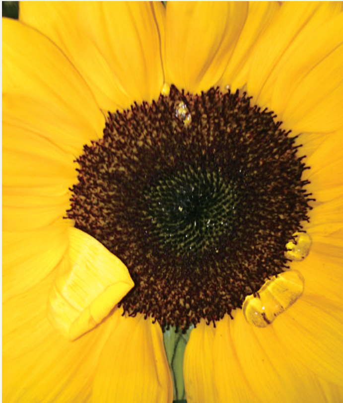
散歩の途中に見つけた元気なヒマワリに、夏の到来を感じます。ヒマワリが持つ太陽の方向を追うように動くその性質に由来し、英名は「SunFlower(太陽の花)」、花言葉は「あなただけを見つめる」だそうです。