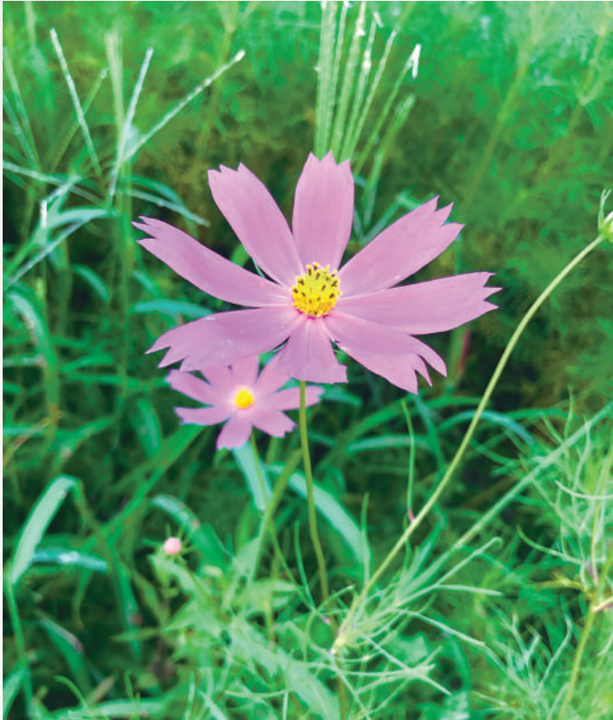
ピンク色のコスモスが秋風に揺られていました。葉も茎も細く、一見か弱そうなコスモスですが、雨風に倒れても、そこから根を出し立ち上がるほどの強さがあります。このコスモスのように「くじけない芯の強さ」を持ってほしいものです。