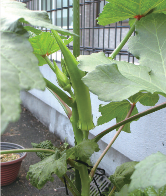
病院の展望庭園でオクラを見つけました。 猛暑が続くにもかかわらず、とても元気に育っています。 このオクラを見習って、私達も暑さに負けないよう頑張らしましょう。