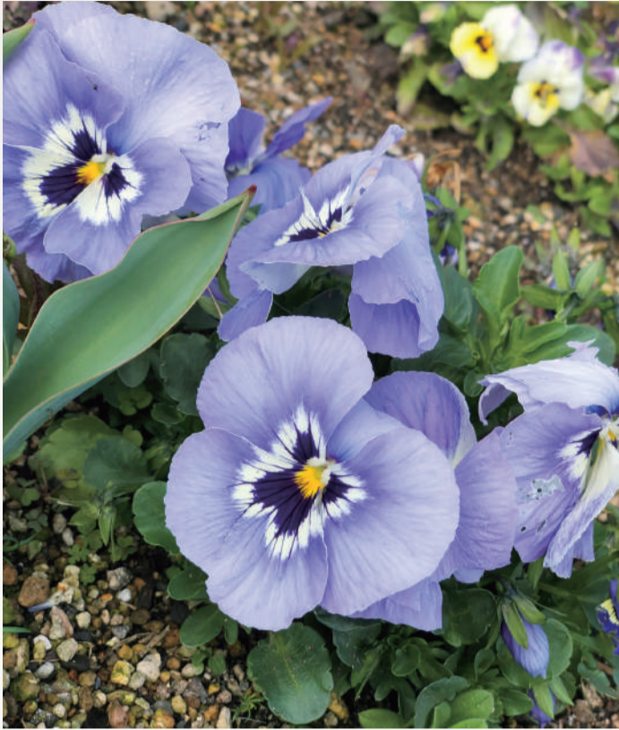
ぽかぽか陽気の日がだんだん増えてきた今日この頃。 お散歩をしながら、春のお花を楽しんでみてはいかがでしょう？ 展望庭園にもパンジーが元気に咲いていました。