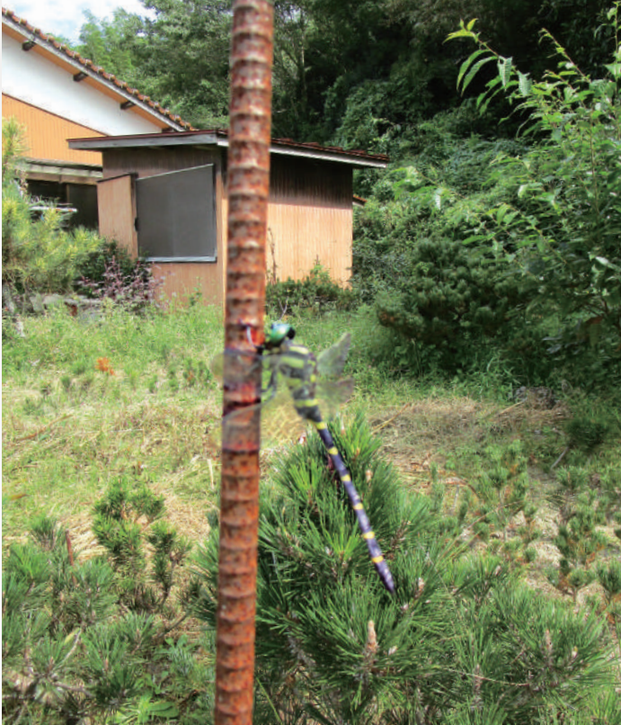
散歩の途中でオニヤンマを見つけました。 ふとした瞬間の虫や花の様子からも 季節の移り変わりが感じられますね。