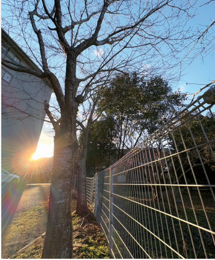
病院敷地内にある桜に小さな芽を発見！ 温かい春が来るのを待ちわびているように見えました。